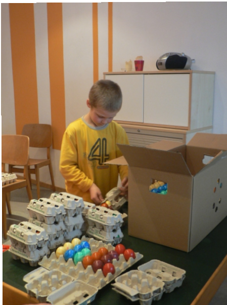
Schwerstarbeit: Über 1000 Eier verpacken, Eierschachteln beschriften und Verladen auf einen Leiterwagen.

An zwei Donnerstagen zogen wir durch die Gartenstadt und boten unsere Eier feil. Hinter jeder Haustüre gab es spannende Begegnungen: "Letzes Jahr wart ihr doch auch schon da" - "ich gebe euch 2 Euro und die Eier dürft ihr selber essen" - "ich nehme 6 Eier und gebe euch 10,00 Euro." " ich habe schon auf eurer homepage nachgelesen, wer ihr seid."