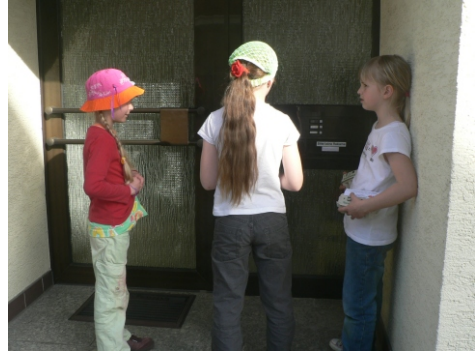
Mal gespannt, wer jetzt gleich öffnet und wie viele Eier wir verkaufen...

Und so dachten wir: Das machen wir wieder. Und da unser Kanu hauptsächlich auf dem Trockenen saß, nämlich bei Kreiters in der Scheune,