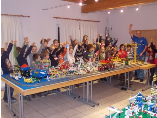
Hurra, wir haben es geschafft: Die Stadt steht.