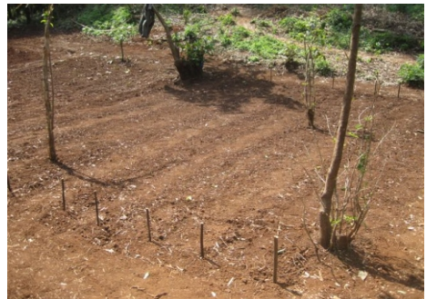
Die Arbeit ist getan - Warten auf das Wachstum...

Die Abende verbrachten wir in unserer "Wohnung". Wir gingen früh zu Bett und wurden mehrmals gestört von dem über den Lautsprecher betenden Priester der Orthodoxen Kirche der ab 4 oder 5 Uhr