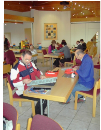
Alles wieder ordentlich abbauen: den Erwachsenen macht es auch Spaß!