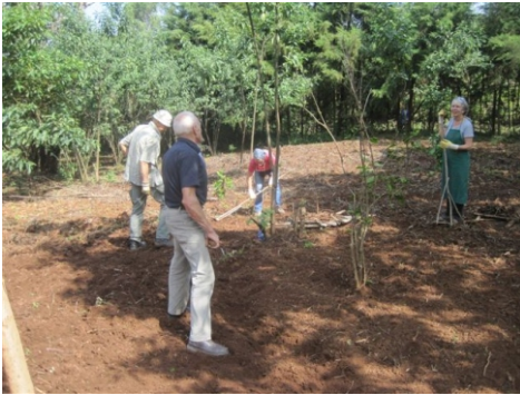
Gartenarbeit unter afrikanischer Sonne